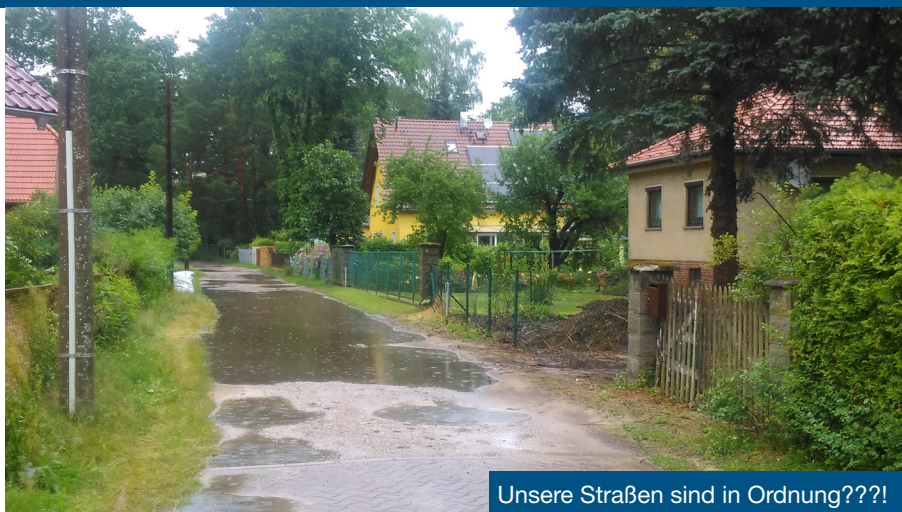
Unsere Straßen sind in Ordnung???

Im Übrigen entsteht mit der Beauftragung der Planung die Beitragspflicht des Grundstückseigentümers. Spätestens zur Einladung der Vorstellung der Straßenplanung wird dann aber von den Anwohnern nochmals auf das seit letztem Jahr gefasste Gesetz verwiesen, dass keine Straßenbaubeiträge mehr zu erheben sind. Das immer wieder genannte Gesetz