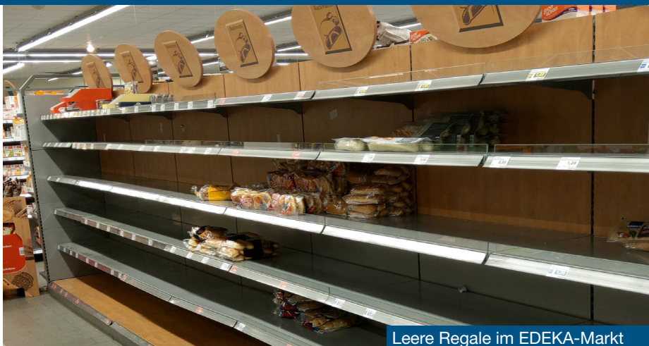
Leere Regale im EDEKA-Markt

Seit über 30 Jahren bin ich in Schönwalde als Ärztin tätig, aber mit einer Situation wie jetzt bin ich in diesen Jahren noch nie konfrontiert worden. Leere Regale in den Supermärkten kannte ich zuletzt aus meiner Studentenzeit in der DDR. Damals konnte man damit umgehen, dass es zeitweise nicht das beliebte Spee-Waschmittel gab, dass man am Fleischstand Eier bekam, weil im gesamten Norden der Republik die Maul- und Klauenseuche ganze Viehbestände ausgerottet hatte. Wir Studenten durften über Ostern nicht nach Hause, weil der Bahnhof auf Grund der Seuche geschlossen war. Und jetzt? Wir sind es nicht mehr gewohnt, dass wir plötzlich nicht mehr alles im Überfluss bekommen, dass wir nicht mehr reisen können, wohin wir wollen, dass wir starken Einschränkungen im täglichen Leben ausgesetzt sind. Wir sollen Kontakte vermeiden, und das alles nur wegen eines kleinen Virus. Es hat die Macht, unser gesamtes Tun, unser gesellschaftliches und wirtschaftliches Leben in den Ruhemodus zu versetzen. Da müssen sich plötzlich Eltern mit den Kindern hinsetzen und Schulaufgaben lösen. Jetzt merken viele von ihnen sicherlich, was unsere Lehrer und Erzieher sonst so leisten müssen und jetzt im Homeoffice leisten. Die Seniorinnen und Senioren sollen nicht mehr besucht werden, weil sie eine Infektion mit COVID 19 nicht überleben könnten. Dabei sind es gerade sie, die auf soziale Kontakte angewiesen sind. Das tägliche Leben findet durch Plexiglasscheiben statt, weil sich das Virus durch Tröpf-